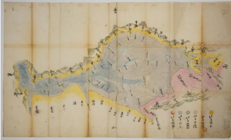
〔児島湾の漁場の図〕

興除新田が開かれた文政 6 年(1823)以前とみられる児島湾の図で、海の中に溝(海底の水路)と、漁の仕掛けの位置が描かれています。