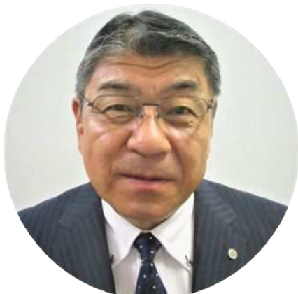
教育長 三宅 泰司