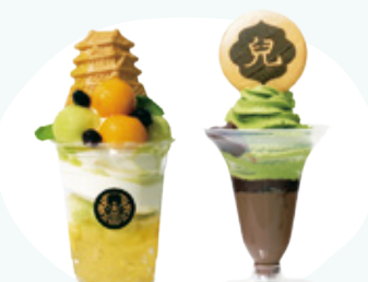
お城パフェ ※画像はイメージです