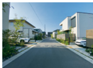
コモンステージ天瀬南町 (北区天瀬南町)