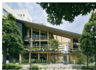
NISHIGAWA TERRACE (北区田町一丁目)