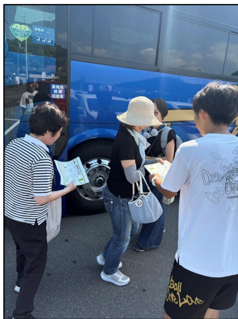
観光バスで来られた方へ、 チラシ配布

スタンプラリーへ 参加してくれた方へ ビーマックスで作成 したグッズをプレゼント