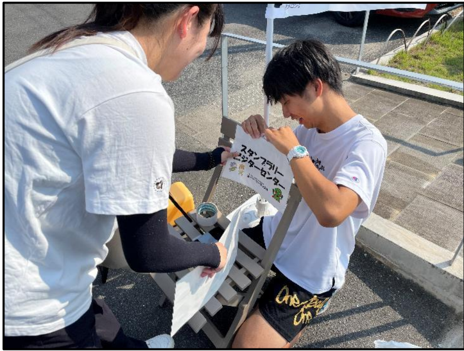
各観光スポットに ブースを設置