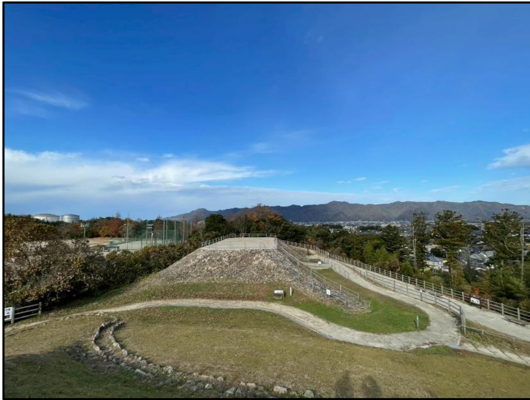
西谷墳墓群史跡公園