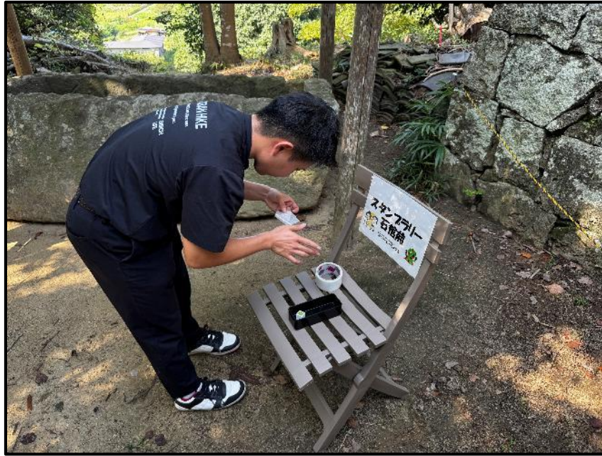
周りやすいように 地図も付けて作成