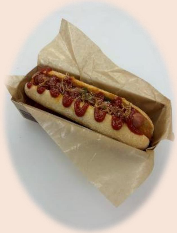
↑完成したホットドッグ