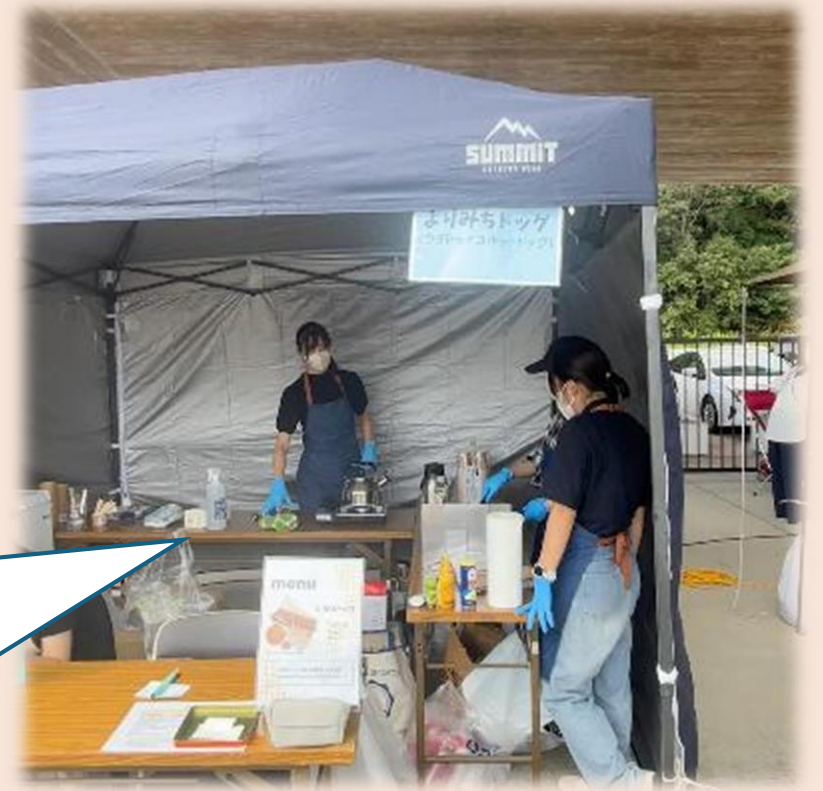
瀬戸内のマルシェで 販売を行っている様子