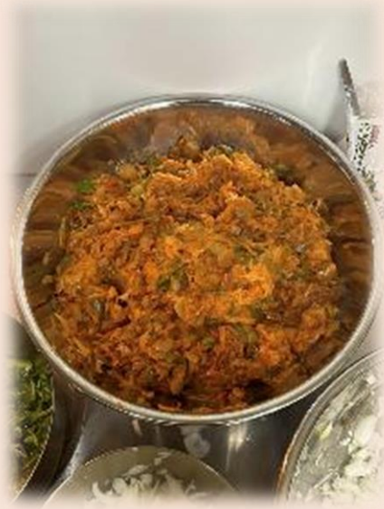
規格外の玉ねぎを使用したナポリタン味の ソース