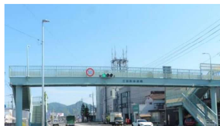
⑤三浜町歩道橋 自動車交通量：12,041台/日