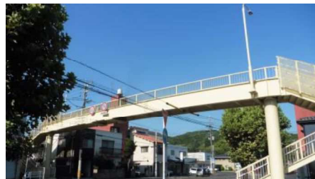
②門田横断歩道橋 自動車交通量：15,769台/日