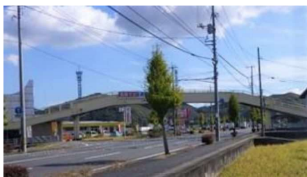
④二軒屋横断歩道橋 自動車交通量：11,761台/日