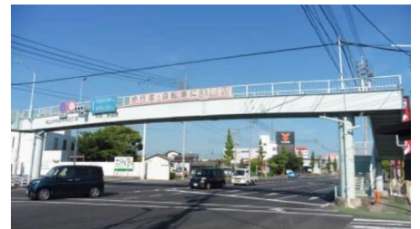
③平井歩道橋 自動車交通量：35,203台/日