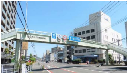
①津島西坂横断歩道橋 自動車交通量：19,136台/日