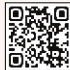
二十歳の集い実行委員会 Instagram