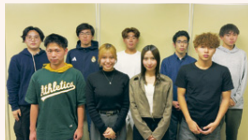
▲令和7年度実行委員会

対象 平成17年4月2日～平成18年4月1日生まれの市内在住・在勤・在学の 人またはその経験者