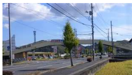
④二軒屋横断歩道橋 自動車交通量：11,761台/日