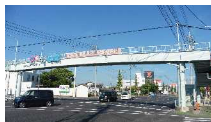
③平井歩道橋 自動車交通量：35,203台/日