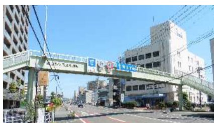
①津島西坂横断歩道橋 自動車交通量：19,136台/日