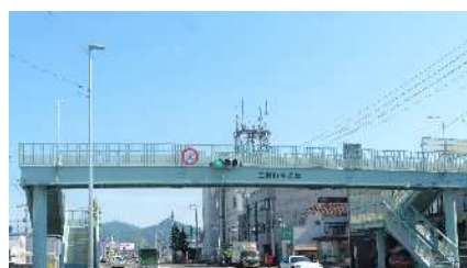
⑤三浜町歩道橋 自動車交通量：12,041台/日