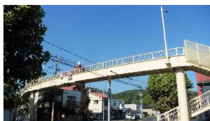
②門田横断歩道橋 自動車交通量：15,769台/日