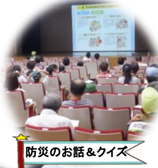
防災のお話&クイズ