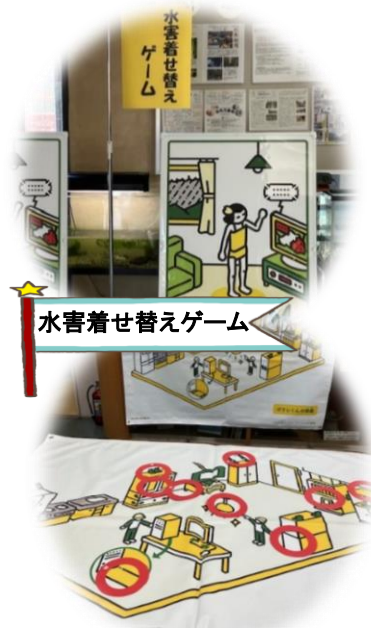
水害着せ替えゲーム