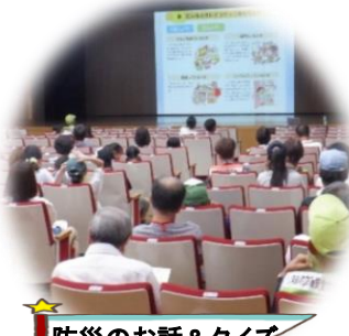
防災のお話&クイズ