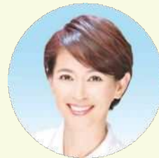
スペシャルアンバサダー 有森 裕子 さん (岡山県出身)