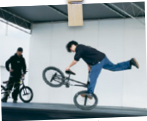
BMXの迫力あるパフォーマンス

伝統芸能や小学生の金管バンド演奏、ダンス、BMXなど幅広いジャンルのパフォーマンスで会場は盛り上がりました。