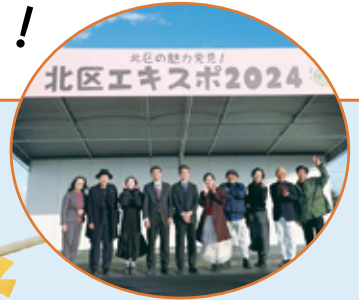
北区の魅力発見！ 北区エキスポ2024