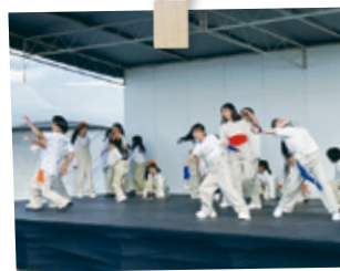
ダンススクールの子どもたちによるダンスショー