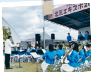
庄内小の児童による金管バンドの演奏