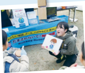
防災展示や防犯情報を発信