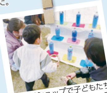
ワークショップで子どもたちが遊びながらSDGsについて学びました