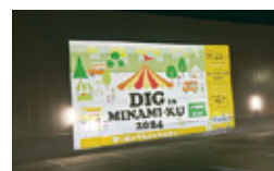
▲備蓄倉庫壁面への投影の様子