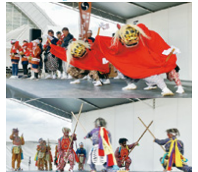
建部町地域伝統の棒遣いや獅子舞を披露