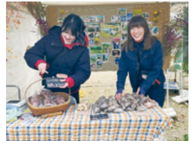
地域おこし協力隊が活動地域の魅力発信や地場産品などを販売