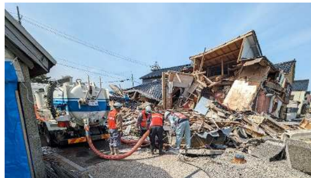
輪島市における下水道管きよの調査状況