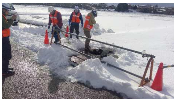
小松市における下水道管きよの調査状況