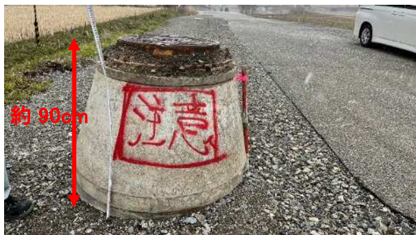
地震によるマンホールの隆起