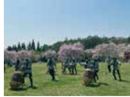
▲はっぽね太鼓の様子