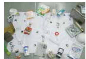
▲「防災博士の挑戦状」のグッズ