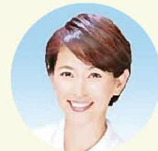
スペシャルアンバサダー 有森 裕子 さん (岡山県出身)