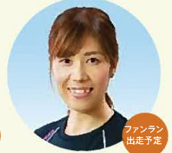
重友 梨佐 さん (元天満屋)

大会前日の受付日に 「縁結びinおかやまマラソン」 ランナー同士の出会いイベントを実施予定 ※要事前申込(詳細は大会HPをご覧ください。)