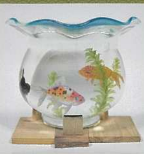
「ハーブ・ユニバース」2018年

まるで本物。 代表作「金魚酒シリーズ」から 最新インスタレーションまで 一挙公開!