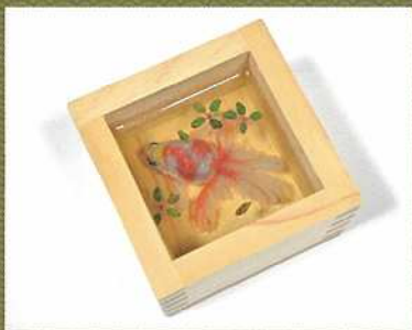
「金魚酒 命名 鈴夏」2021年