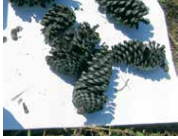
B お花炭をつくってみよう