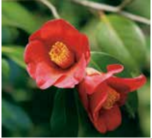
A 半田山植物園のツバキをみる会