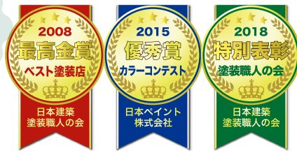
(下記は見積例です)