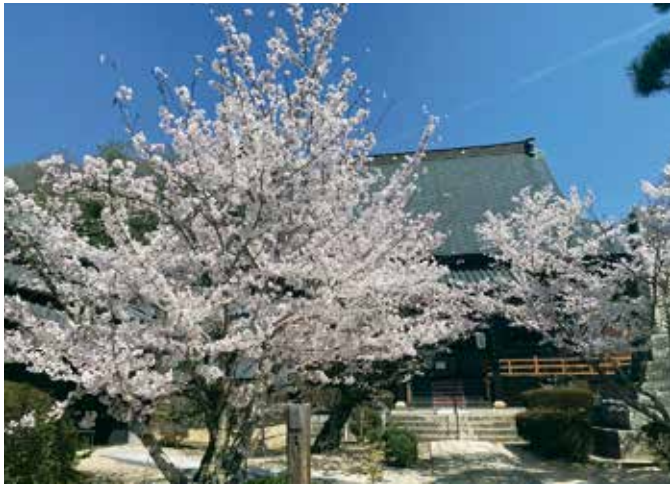
▲勅命山日応寺の桜

旭川の土手の桜が散り始めたころに見頃となるため、桜を見逃した！という人も日応寺で花見を楽しめます。花見の後は、日応寺自然の森スポーツ広場で遊ぶもよし。勅命山日応寺を訪れるもよし。多くの見どころがある北区日応寺へ、桜を見にお越しください。