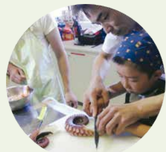
過去の親子お魚料理教室の様子