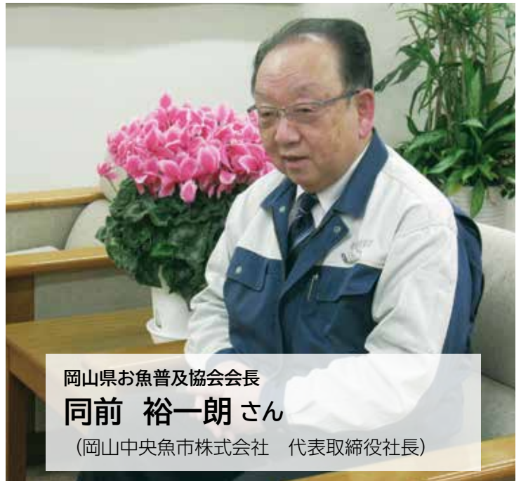
岡山県お魚普及協会会長

中央卸売市場は、市民の台所を支えるという重要な役割を担っています。「良いものは良い」と魚の価値を適正に評価し、安定した供給を行うことが市場の務めです。瀬戸内は非常に良い漁場に恵まれており、瀬戸内の鮮魚を取り扱う強みを活かしていきたいですね。魚食普及の推進を継続することで若い世代にもより魚を好きになっていただき、合わせて、ぜひ市場にも興味をもってほしいと思います。