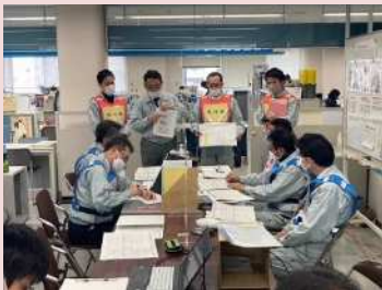
コントローラー（訓練を仕掛ける側）