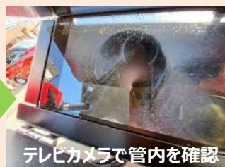
テレビカメラで管内を確認