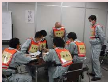
プレイヤー（訓練を行う側）