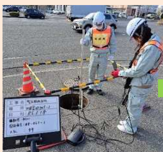
管路被害の測量調査