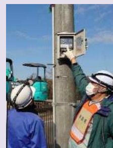
処理場・ポンプ場の被災調査