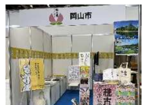
展示会出展イメージ