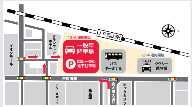
※現地看板を参考にしてください

詳細は、お問い合わせいただくか、HPをご確認ください。ご不便をおかけしますが、ご協力の程よろしく申し上げます。