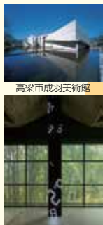
高梁市成羽美術館 宮島達男《Counter Falls》2018 Installation view in the exhibition Sky of Time (2019-2020) at EMMA - Espoo Museum of Modern Art / Saastamoinen Foundation