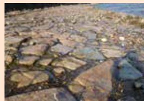
▲緻密に組み立てられた石組み