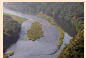
▲旭川上流から見た井堰全景