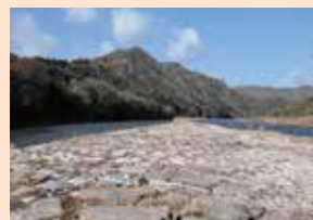
▲除草・土砂撤去時の井堰

旭川が備前と美作の国境をなしていたことから、川の中央で途切れた片持式の特異な構造の斜め堰となっています。全長650mの堰は、現存する日本最大の農業用の石造取水堰で、現役でありながら江戸初期の姿を良好な状態で保っています。