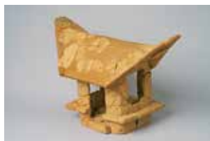
▲建物形埴輪（金蔵山古墳出土）