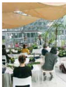
E 迎春 門松風寄せ植え