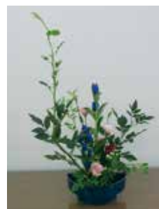
D 花とあそぼう～クリスマス向け生け花～

灘崎 〒709-1215 南区片岡186 ☎086-362-5277 開館時間 9時～17時 休館日 月・第2日曜、祝日、12/28～1/4