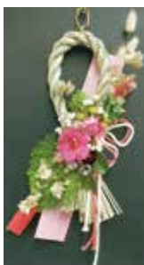
A ドライフラワーで作る洋風しめ縄リース