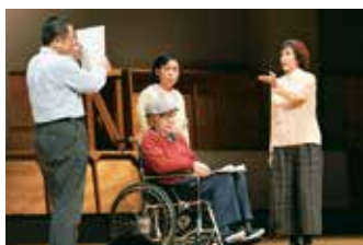
▲老いのプレーパーク『新しい生活シアター』（2021）