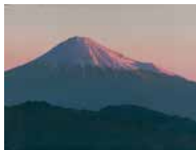
▲羽田裕『黎明富士』2019年 ホキ美術館