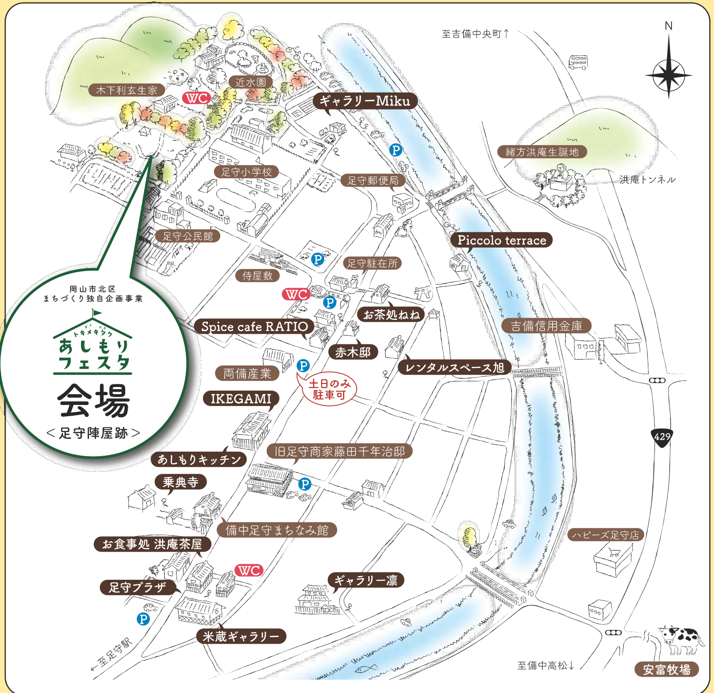
< 岡山市北区足守 町並み保存地区周辺 >