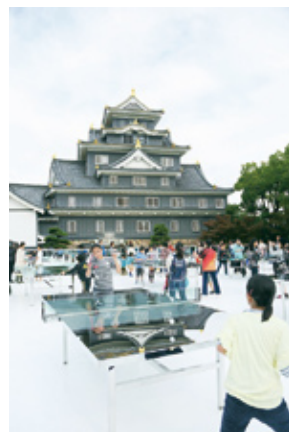
▲2014年岡山城前で展示の様子

untitled 2012 (who if not we should at least try to imagine the future, again) (remember Julius Koller) 無題2012 (そうする人が誰もいなかったとしても少なくとも僕らは、もう一度未来について想像しようとするべきだ) (ジュリウス・ケラーを忘れるな) Rirkrit Tiravanija リクリット・ティラヴァーニャ ©Rirkrit Tiravanija, 2012 Courtesy of Imagineering 製作委員会, Gavin Brown's enterprise, NY photo: Koji Ishii