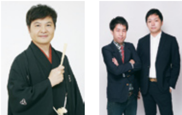
月亭方正 ウエストランド

開演時間 14:00 会場 建部町文化センター (北区建部町建部上) 入場料金 前売=3,500円、当日=4,000円