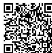
二次元バーコード