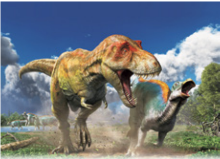
▲「復元画：日本佳代美」