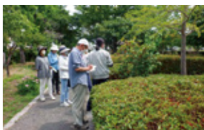
A 公園の植物みてあるき