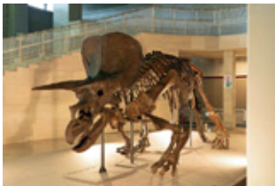
▲トリケラトプス全身骨格標本（レプリカ）所蔵：進化生物学研究所

期間 4月8日(土)～5月21日(日) 費 一般1,400円、小・中・高校生1,000円、3歳～未就学児700円