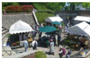
B 半田山春の花まつり