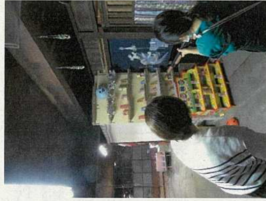
空き家を有効活用するイベントの 企画&実施(NO.17)