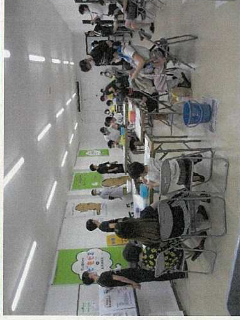
表町商店街で子どもゼミ開催(NO.9)