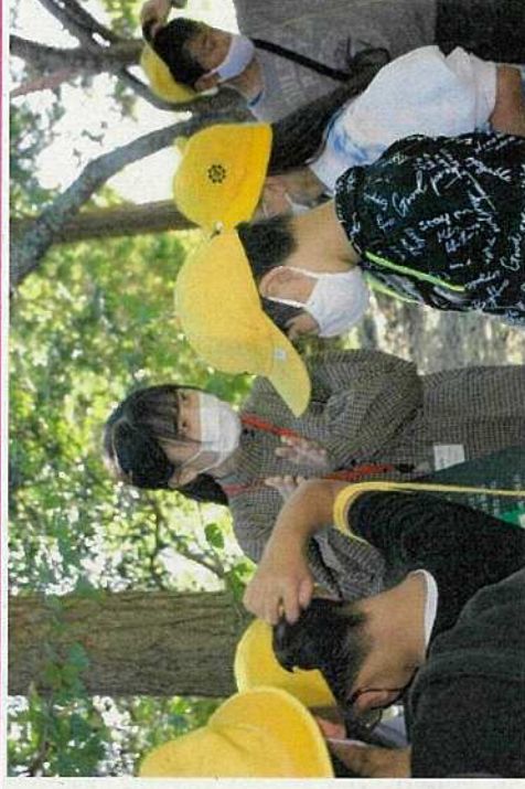
造山古墳のボランティアガイドとして活動(NO.10)