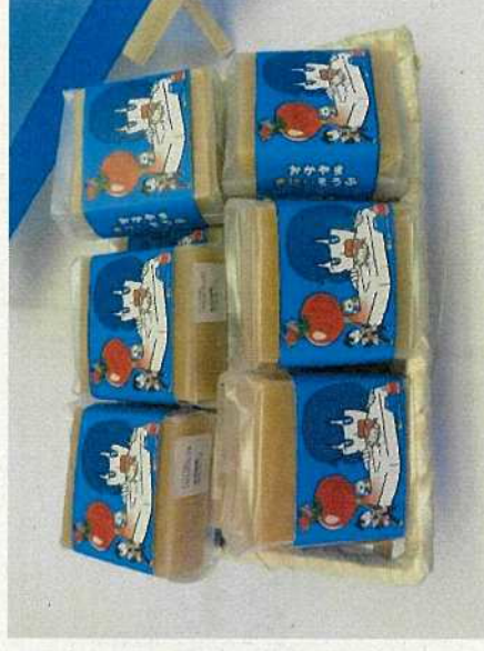
廃棄野菜を活用した石鹼の開発&販売(NO.20)

※説明文の( )内は、(資料2)の事業NOです。 事業内容の詳細については、(資料2)をご覧ください。