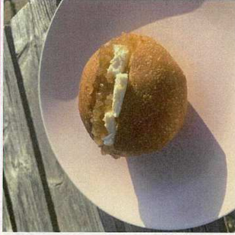
オリジナルジャムサンドの開発&販売 (NO.3)