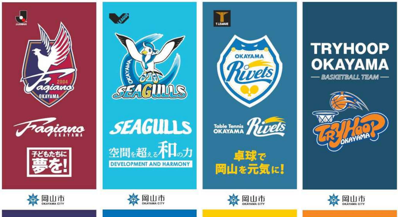
ファジアーノ岡山

バナーフラッグ、デジタルサイネージ、看板デザイン(※掲出媒体によって大きさ等は異なります。)