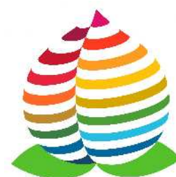
岡山市SDGs推進ロゴマーク