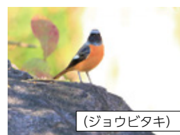
D バードウォッチング (ジョウビタキ)

瀬戸町 〒709-0856 東区瀬戸町下188-2 ☎/☎086-952-4531 開館時間 10時～18時 休館日 月曜、第2日曜、祝日、12/28～1/4・8～10