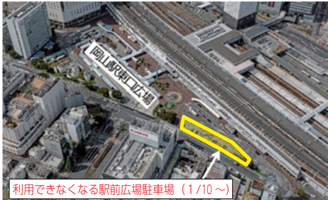
利用できなくなる駅前広場駐車場 (1/10 ~)