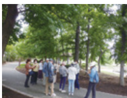
A 公園の植物みてあるき