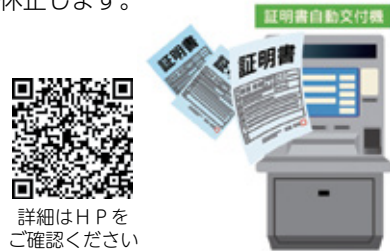
詳細はHPをご確認ください

☎ 区政推進課 ☎ 086-803-1033 1月21日(土)は、システムメンテナンスのため、天満屋地下街市民サービスコーナーを臨時休業します。 また、証明書自動交付機・コンビニエンスストアなどでの証明書交付も同日休止します。