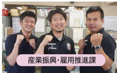
産業振興・雇用推進課

【課題概要】 岡山市のまちなか活性化に向けて、時間や日数に縛られない方法で通行量調査を行った際のデータ活用についてニーズの可能性を検証したい。