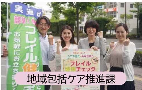
地域包括ケア推進課

【課題概要】 薬局や地域の集まりで行っているフレイルチェックを受ける人を増やしたい。