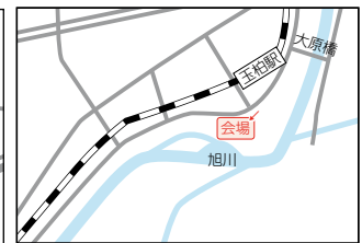
旭川右岸河川敷(北区玉柏) ※旧玉柏自動車練習場