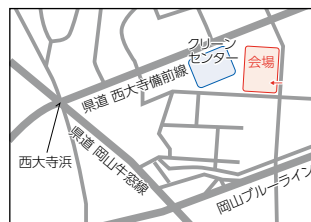
吉井川浄化センター (東区西大寺新地)