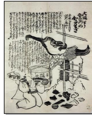
『大坂下りなまづのかるわざ』 〔国富文庫〕より