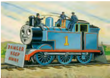
レジナルド・ダルビー『トーマスのさかなつり』1949年 ©2022 Gullane(Thomas)Limited.

期間 3月26日(土)～5月8日(日) 費 一般・高校生1,000円、小・中学生800円、3歳以上小学生未満600円