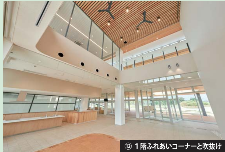
⑫ 1階ふれあいコーナーと吹抜け