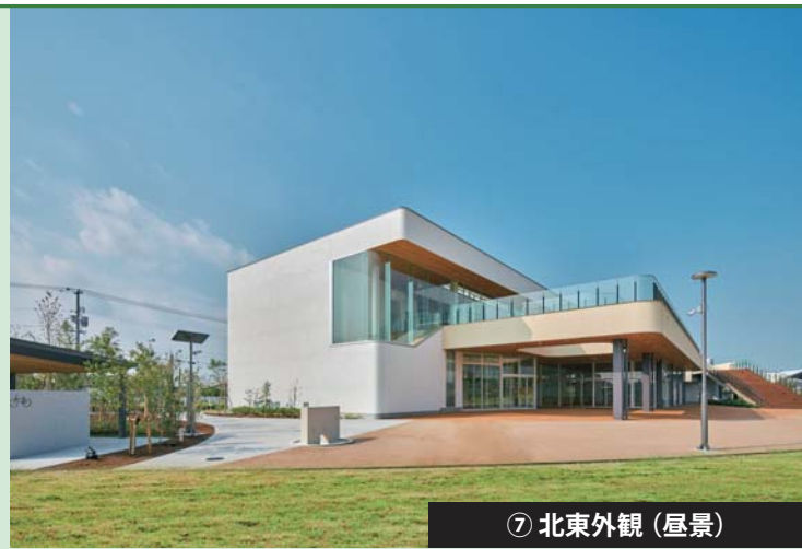
⑦ 北東外観 (昼景)