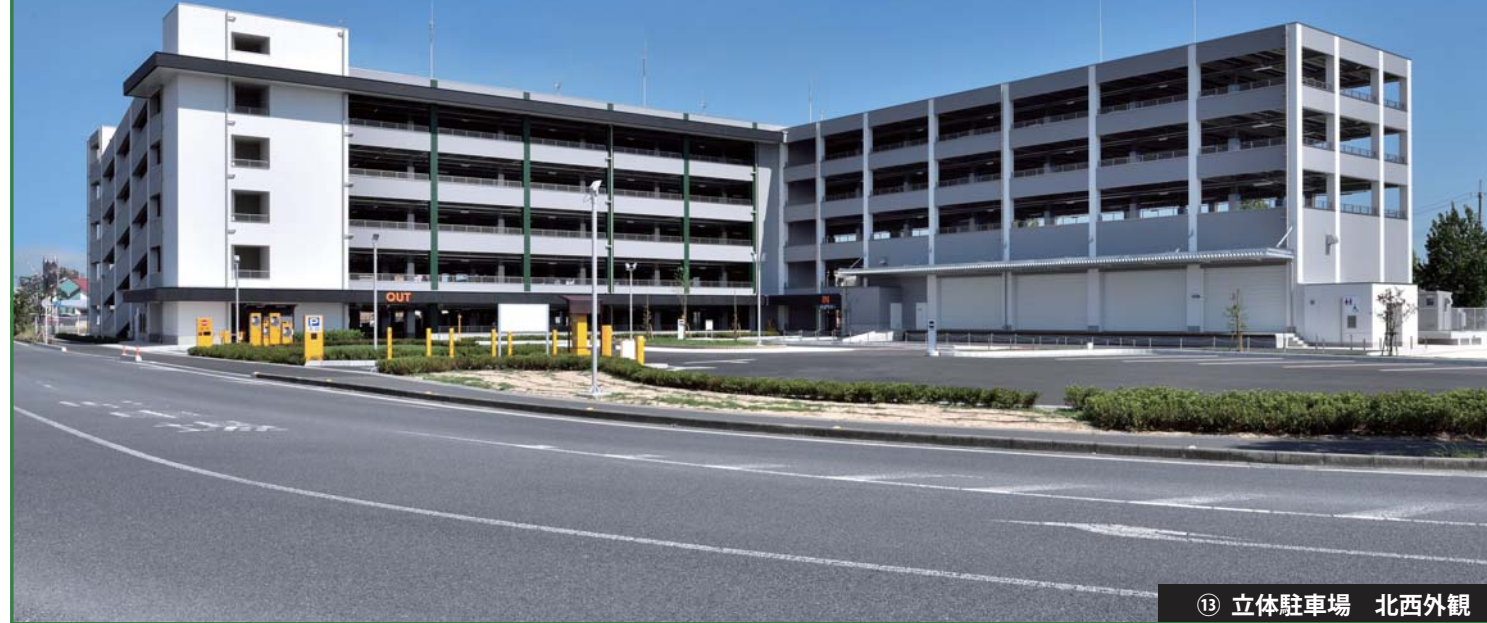
⑬ 立体駐車場 北西外観

岡山西部総合公園 (仮称) 内に公園利用者用の立体駐車場と災害時の物資保管用の防災備蓄倉庫を整備しました。 配置計画は、道路に対して建物をセットバックさせることで敷地周辺への圧迫感を低減させ、また境界部分に柵やフェンスを設けず低木の植栽を配置することで、ゆとりと潤いのある空間としました。 外観は、岡山ドームと合わせ、白とグレーを基調とした落ち着いた色彩とし、西側の柱部分を縦長に日本の伝統色であるもえぎ色 (緑) でアクセントとしました。