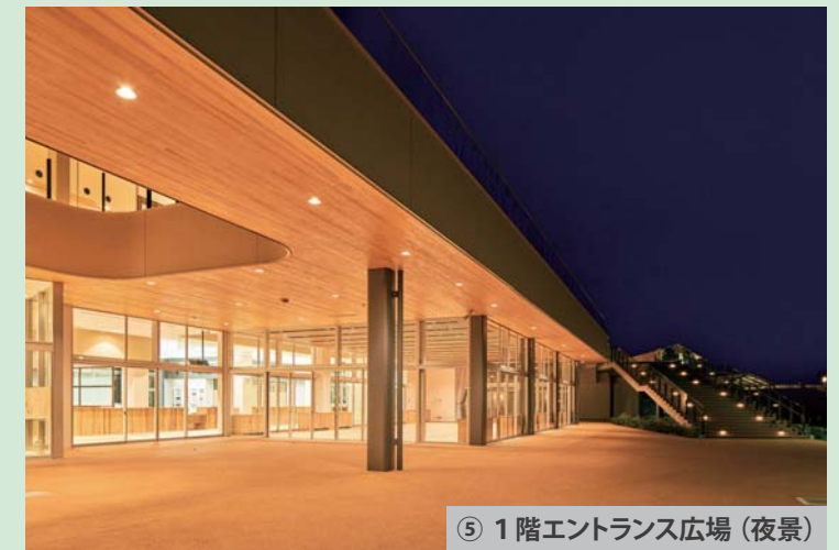
⑤ 1階エントランス広場(夜景)