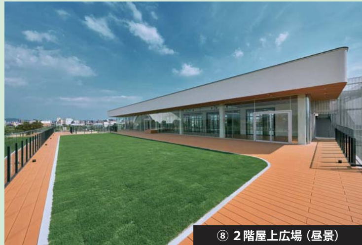
⑧ 2階屋上広場 (昼景)