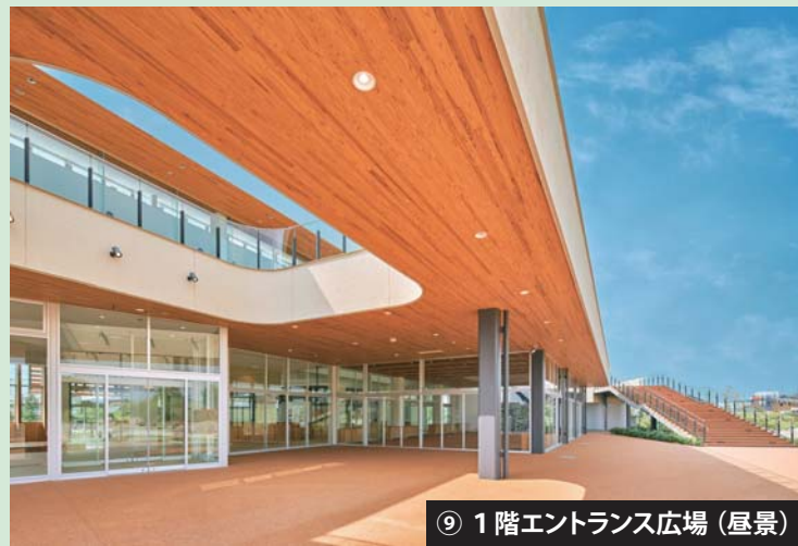
⑨ 1階エントランス広場 (昼景)