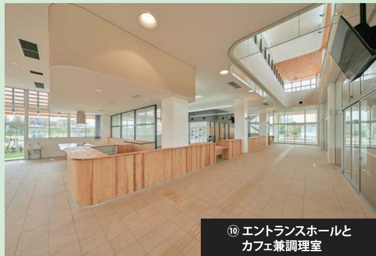
⑩ エントランスホールと カフェ兼調理室