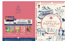
【プログラムブック】