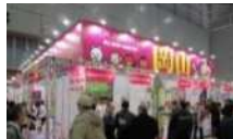
【食品製造業見本市】