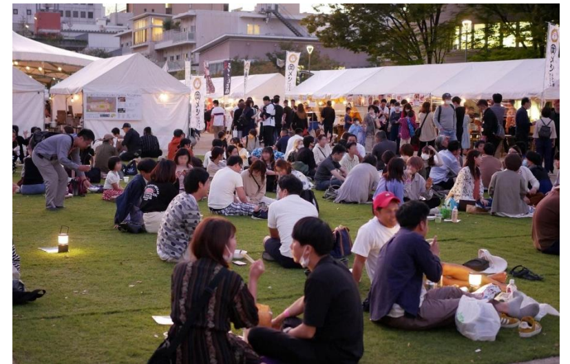
芝生による憩いの空間創出 (南池袋公園)