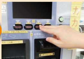
入金する金額のボタンを押します