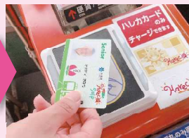
再度、降車口のカードリーダーにタッチします