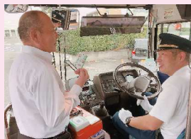
乗務員に入金する金額を告げます

車内でのスムーズな乗降や運行の定時性確保のためにも、 窓口や自動積増機での事前のチャージにご協力ください