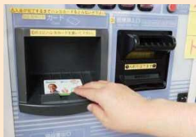
自動積増機にハレカを置きます