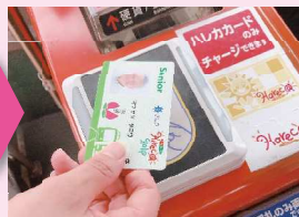
降車口のカードリーダーにタッチします