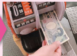
入金する紙幣を挿入口に入れます