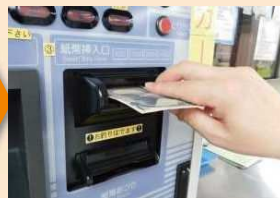
入金する紙幣を挿入口に入れます