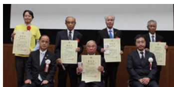
▲まちづくり賞表彰式の様子

住民自治組織、NPO、企業、学校、行政など多様な主体が協働で行う、テーマに沿った地域の社会課題解決に関するもの