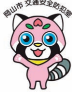
岡山市交通安全キャラクター「まもも」