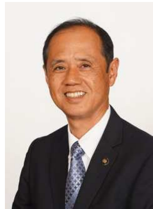
冈山市长 大森雅夫