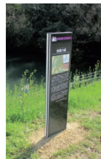
令和元年度設置 中区祇園付近

※広告の内容に関する一切の責任は広告主に帰属します。(広告) 岡山市が推奨等をするものではありません。