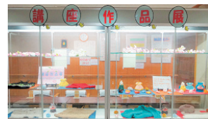
▲昨年の講座作品展