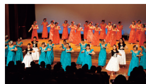
▲昨年の講座発表会