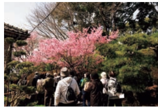
B 四季と自然を楽しむ会