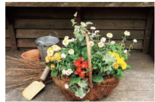
C ガーデニング講座 はじめてのギャザリング寄せ植え