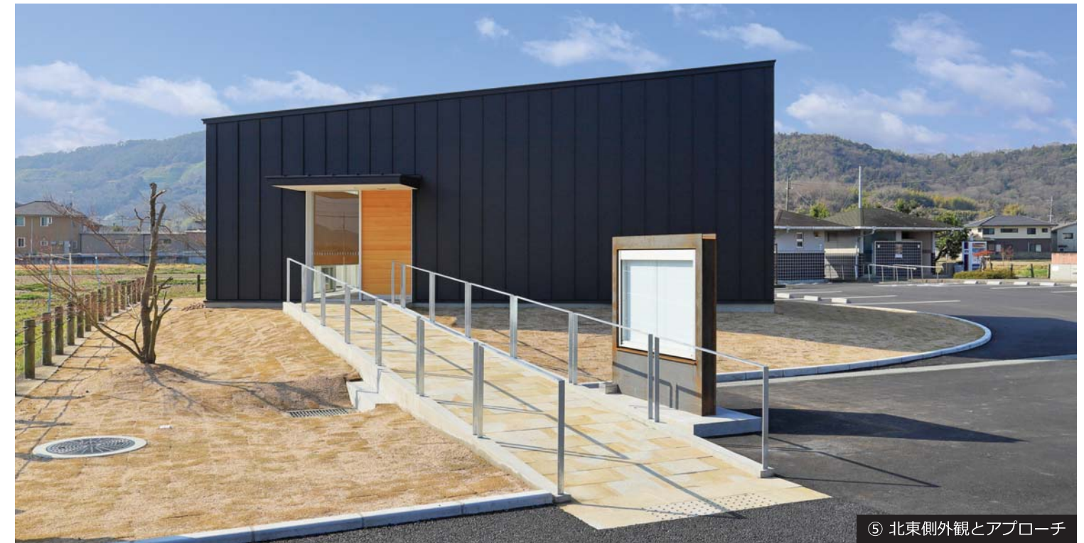
⑤ 北東側外観とアプローチ