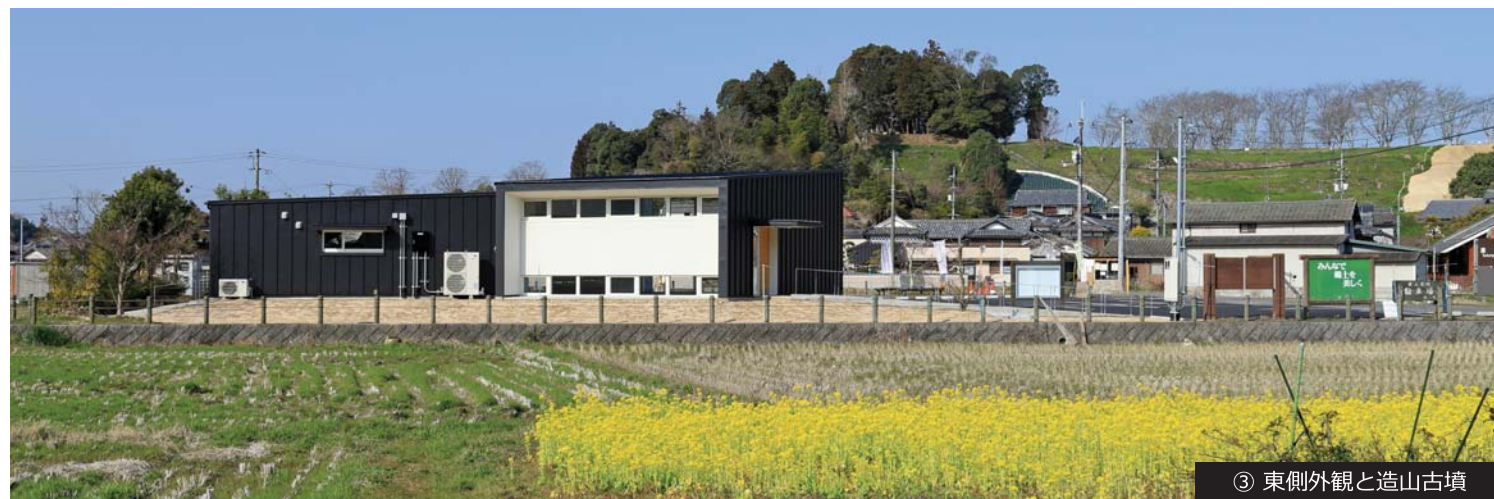
③ 東側外観と造山古墳