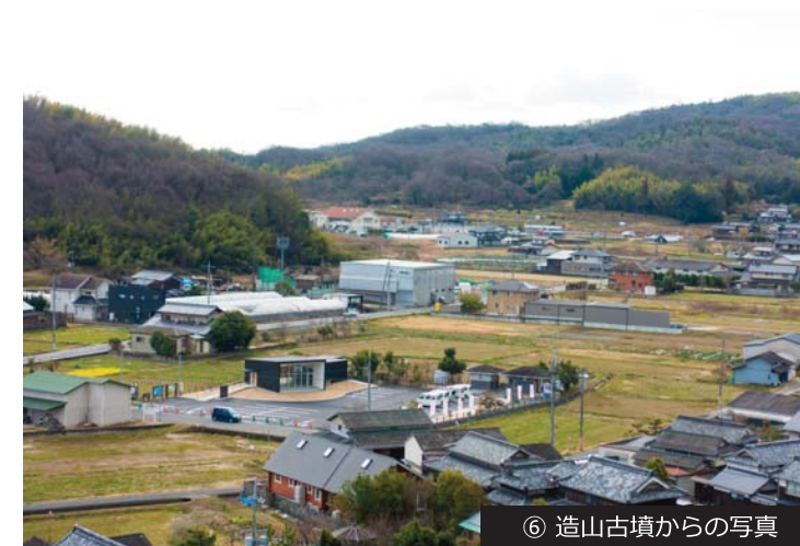
⑥ 造山古墳からの写真