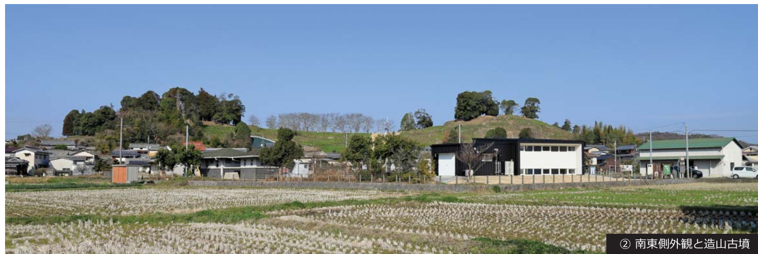
② 南東側外観と造山古墳