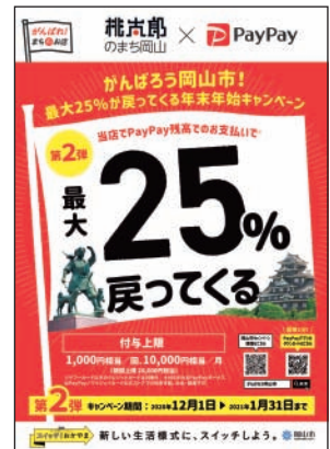
▲キャンペーンポスター