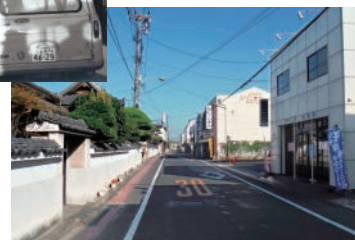
▼令和元年の県道倉敷妹尾線の様子