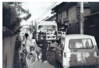
▲昭和41年頃の県道倉敷妹尾線の様子

下の写真は、昭和41年頃の県道倉敷妹尾線です。バスがぎりぎりですれ違う様子と、広く整備された現在の様子です。このように比較して面白い写真や資料を多数ご用意していますので、興味・関心のある団体がありましたら、ぜひご連絡ください。