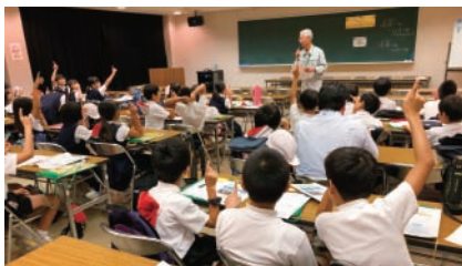
▲たくさんの児童が質問しています

質問の時間には、「僕たちが今すぐできることはありますか？」という質問があり、「おうちのご飯や給食を残さず食べてくれると生ごみの減量化になります。」と答えると、