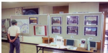
▲今昔パネル展(南公民館)

その際、「ぜひ写真を借りられないか」との声も多くいただいたため、今年度から、公的機関や営利を目的としない町内会などの団体への貸し出し事業を行っています。