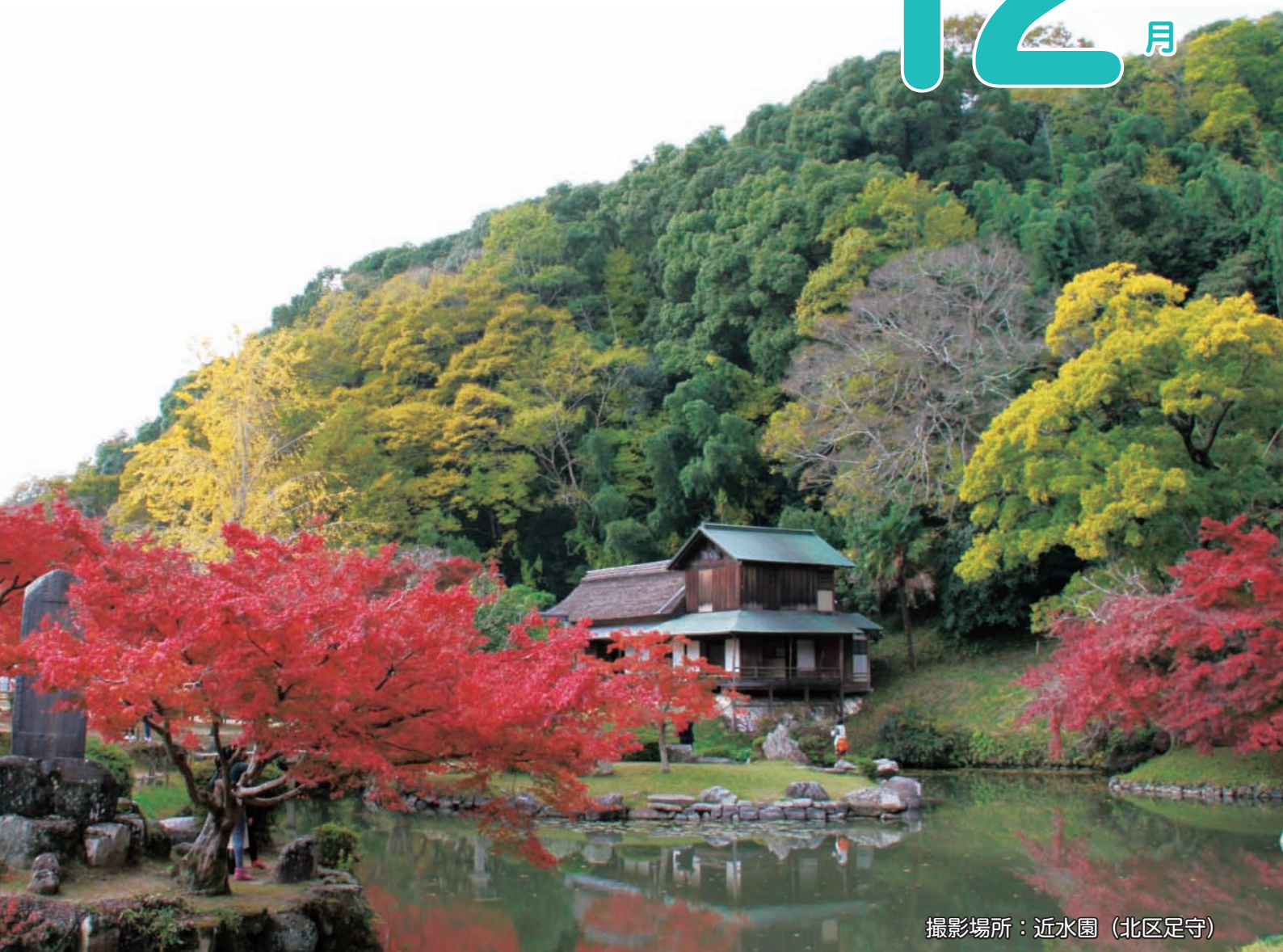
撮影場所：近水園（北区足守）