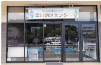
▲富山地域センター

間を平日の9時から19時(土日、祝日、振替休日及び年末年始を除く)に変更し、17時15分から19時までの平日時間外開庁を開始しました。