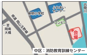
消防教育訓練センター (中区桑野)