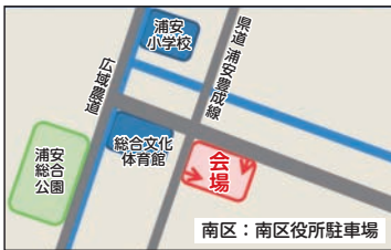
南区役所駐車場 (南区浦安南町)