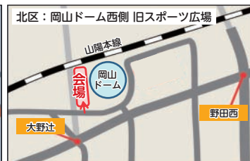
岡山ドーム西側 旧スポーツ広場 (北区北長瀬表町一丁目)