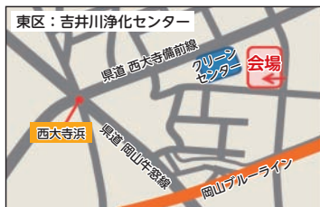
吉井川浄化センター (東区西大寺新地)