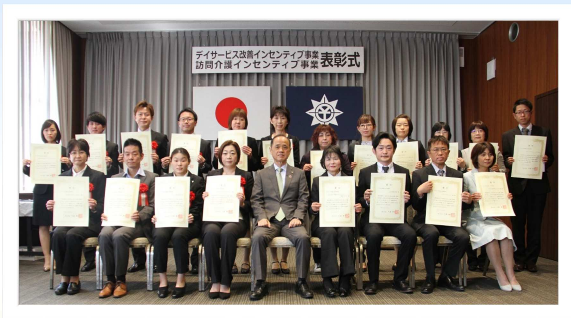
令和元年度 受彰者のみなさん